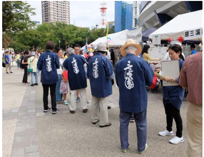
法被には「三溪園」のロゴが入っています。