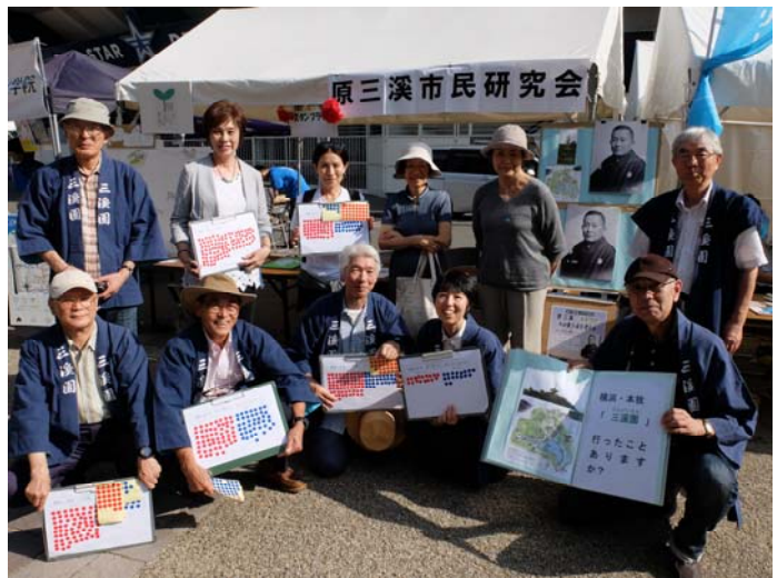
「はい」か「いいえ」で答えてもらい、回答者数をまとめました。