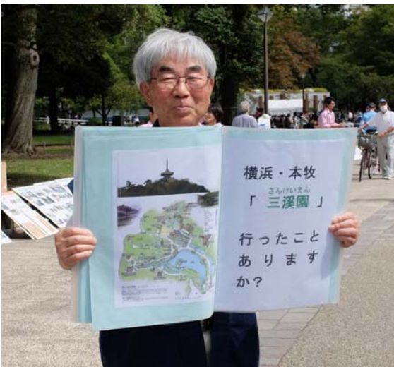
「三溪園に行ったことありますか？」