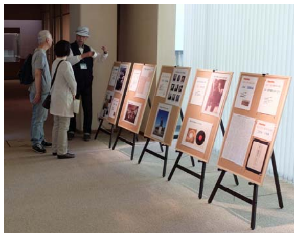
内苑入口でクイズの問題を配布しました。三溪記念館の展示室にヒントがあります。解説コーナーで答え合わせの後、全問正解の方には記念のバッジをプレゼント。