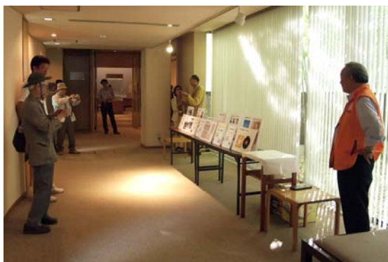
↑記念館の解説コーナーには、富岡製糸場をアピールするオレンジ色のユニフォームを着た会員も駆けつけました。