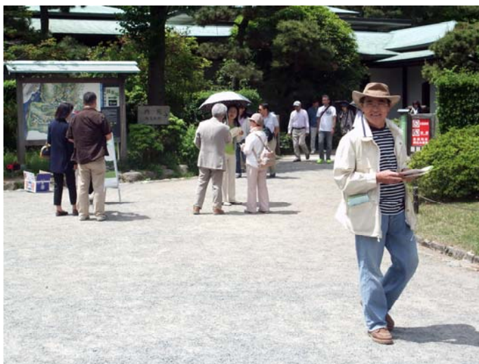
↑内苑の入口で来場者にクイズのパンフレットを配ります。